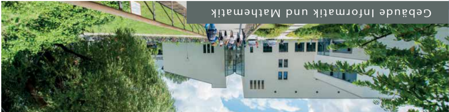
Gebäude Informatik und Mathematik

Sport, Theater, Tanz, Chor, Orchester, Kino, Oper, Kabarett, Poetry Slams – an der Uni und in der Stadt ist immer etwas los. Bei rund 40 Angeboten am Uni-Sportzentrum von Aikido über Klettern und Rudern bis Yoga finden Sie den perfekten Ausgleich zum Studium. Über 100 studentische Gruppen sorgen für ein buntes kulturelles Leben am Campus. Viele Studierende engagieren sich auch im sozialen Bereich, in der Studierendenvertretung oder in einer fachbezogenen Gruppe. So organisieren die Fachschaften die Orientierungswochen, um Studienanfängerinnen und -anfänger den Einstieg ins Unileben und das gegenseitige Kennenlernen zu erleichtern.