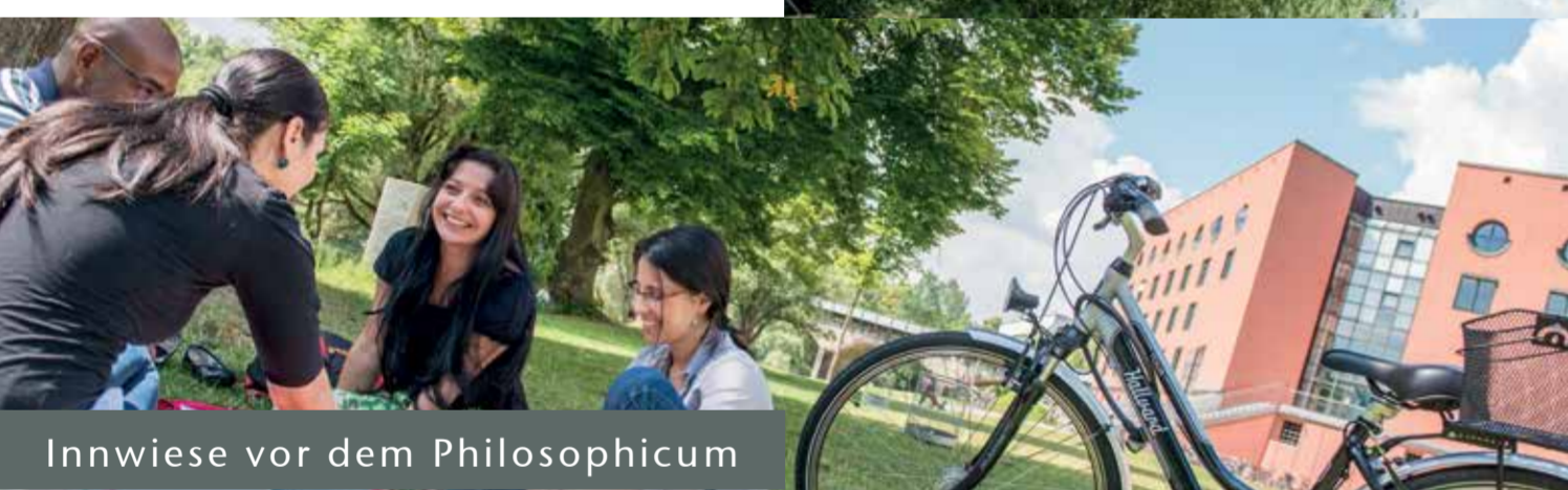
Innwiese vor dem Philosophicum